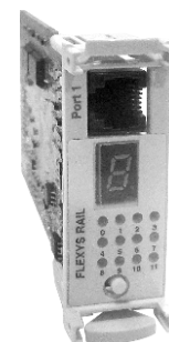
Figure 1.1 : Front view